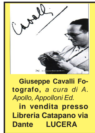
Giuseppe Cavalli Fotografo, a cura di A. Apollo, Appolloni Ed. in vendita presso Libreria Catapano via Dante LUCERA

Poste Italiane spa- Spedizione in A.P. DL 353/2003 (L. 27/2/2004 n.46) art1, comma 2, DCB FOGGIA